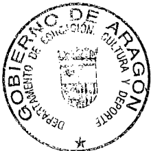
FDO.: EVA ALMUNIA BADIA

LA CONSEJERA DE EDUCACION, CULTURA Y DEPORTE DEL GOBIERNO DE ARAGON,