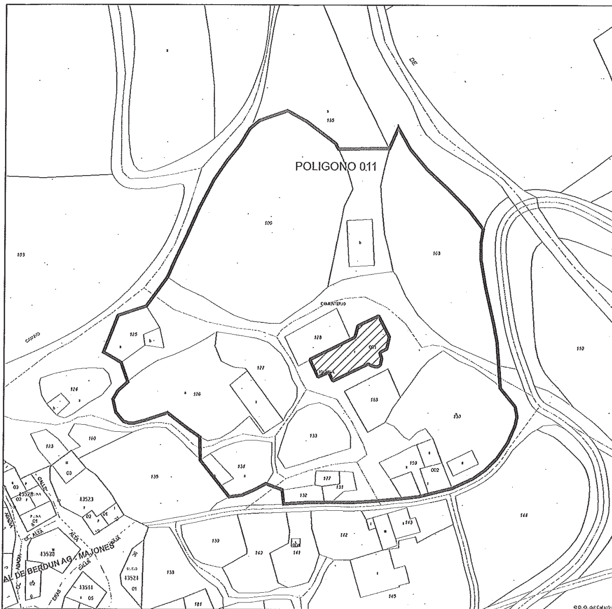
CANAL DE BERDÚN (MAJONES) IGLESIA DE EL SALVADOR