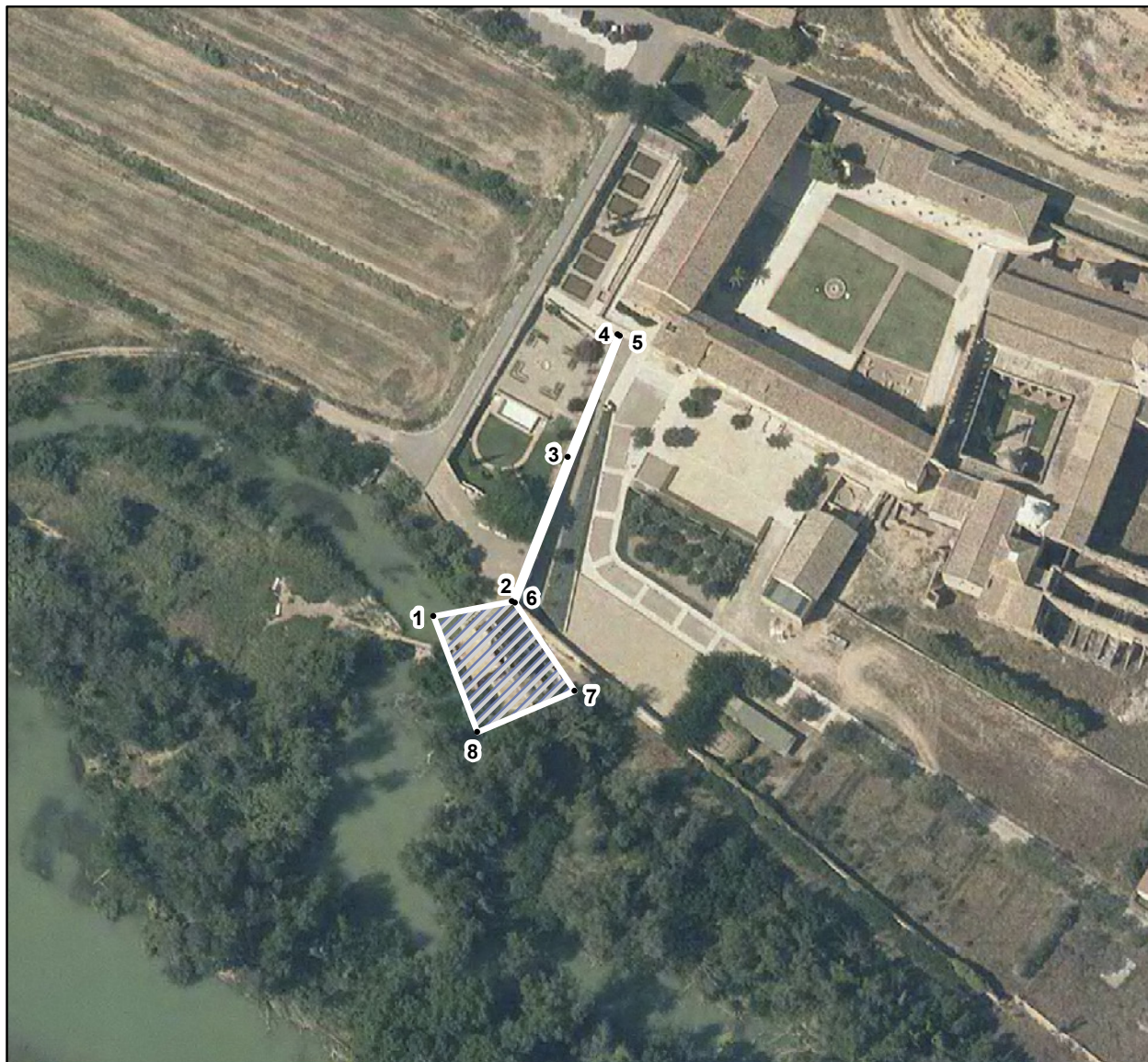
COORDENADAS ETRS89, UTM, HUSO30

SÁSTAGO MOLINO, NORIAL Y ACUEDUCTO DEL MONASTERIO DE NUESTRA SEÑORA DE RUEDA