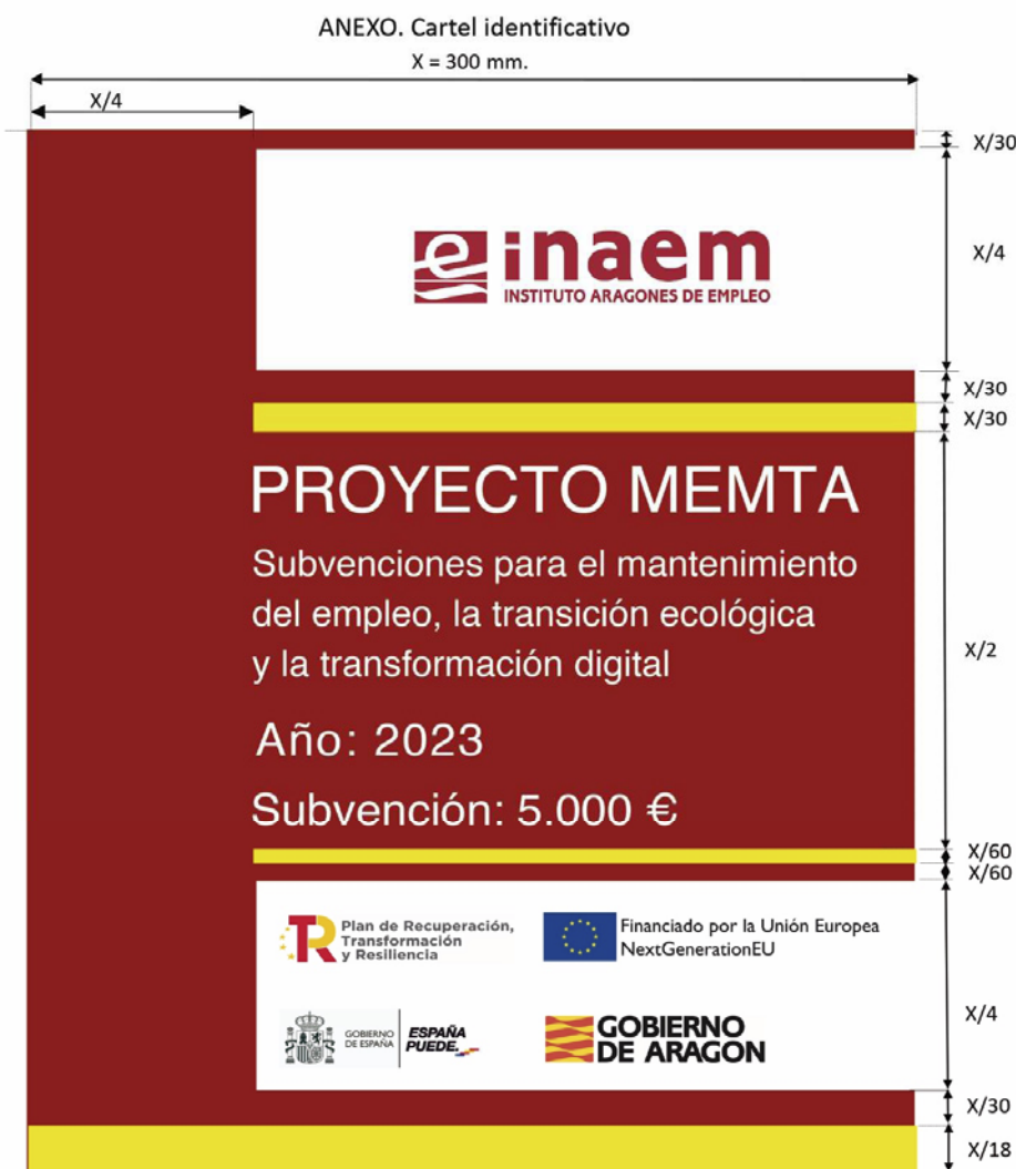
Anexo I. Cartel identificativo (subvención 5.000 €).