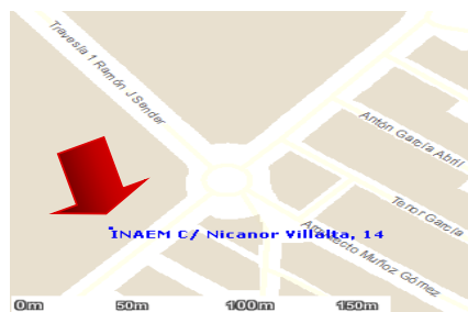
Mapa geográfico de localización:

C/ Nicanor Villalta, 14. 44002 TERUEL Dirección electrónica: empresate.inaem@aragon.es Página web: https://inaem.aragon.es/espacio-empresas Teléfono 978 614 605 Medios de transporte públicos cercanos al centro: autobús urbano líneas A y B