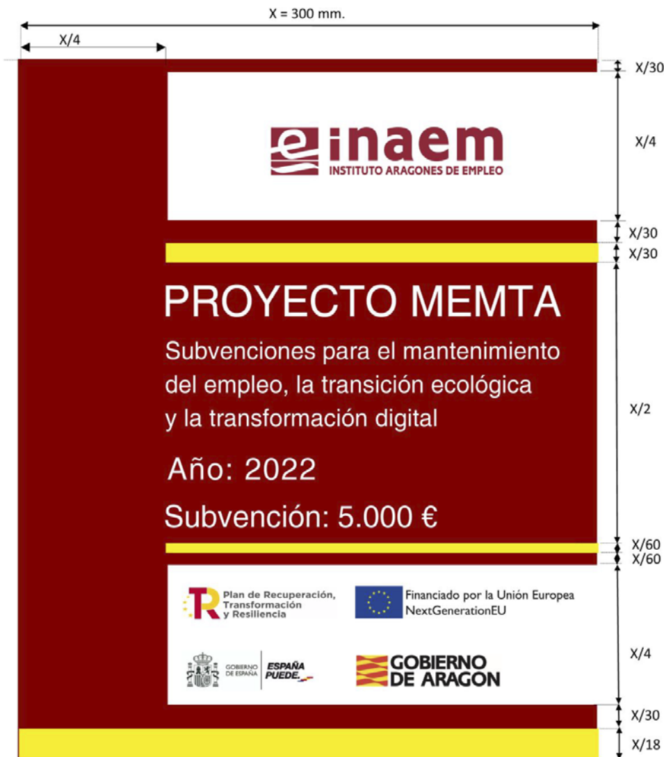
Anexo I. Cartel identificativo (subvención 5.000 €).