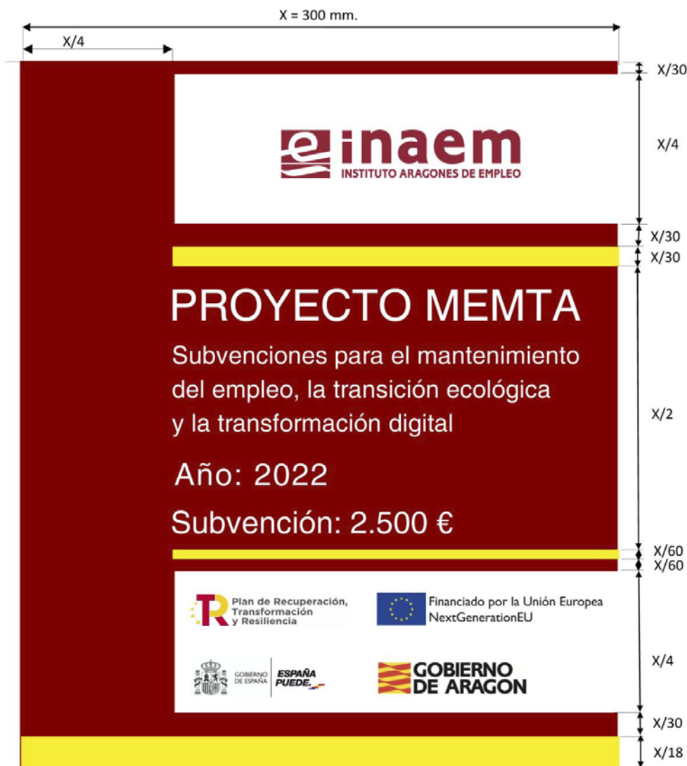
Anexo II. Cartel identificativo (subvención 2.500 €).