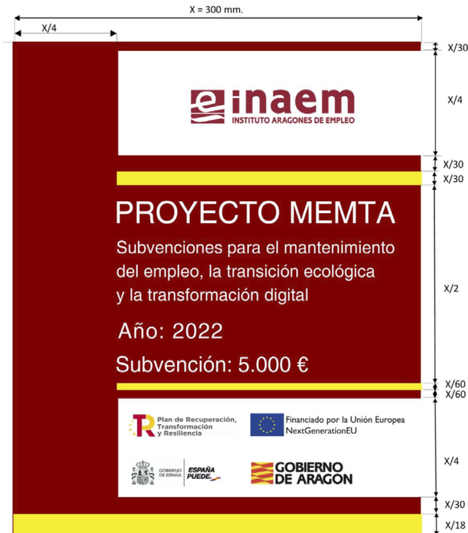
Anexo I. Cartel identificativo (subvención 5.000 €).