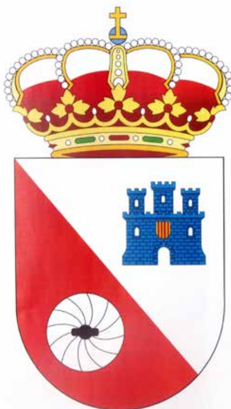
ESPLÚS (HUESCA) Lámina II. Escudo a color